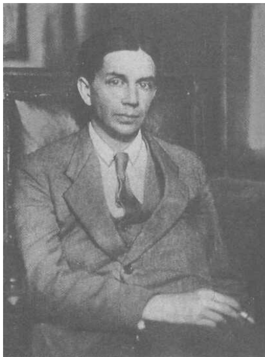
Всеволод Константинович Фредерикс (1885–1944).

Род Фредериксов ведет свое начало от плененного войсками Петра I шведского солдата. Он был депортирован в Архангельск, там обзавелся семьей и на родину