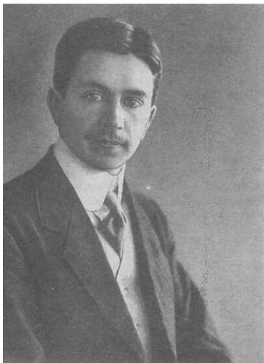
В год защиты докторской диссертации. Женева.