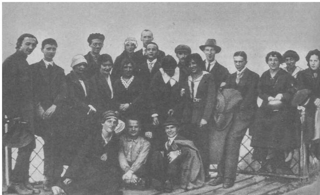
Среди участников III съезда российских физиков во время экскурсии на пароходе по Волге. Нижний Новгород, 1922 г.

теория поля. Одна из статей посвящена аффинно-метрической теореме Эйнштейна 13 , другая — проблеме синтеза ОТО с электродинамикой и квантовой теорией на основе пятимерного обобщения ОТО 14 .