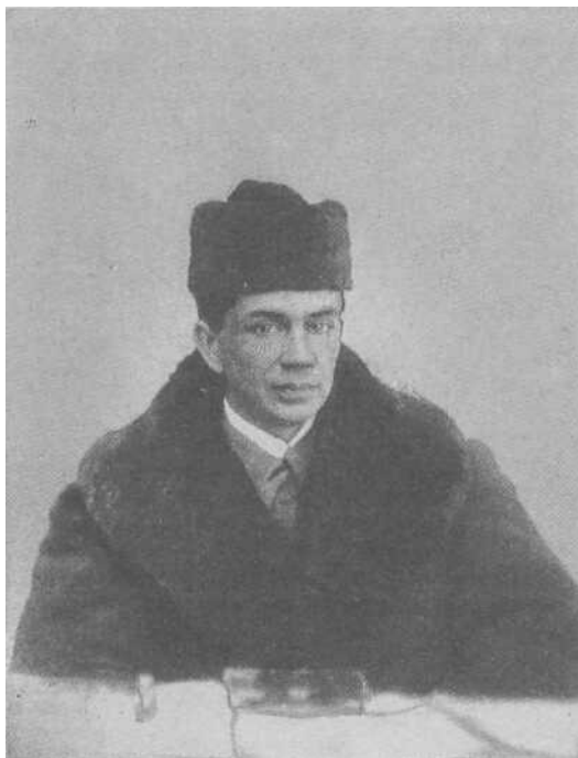
В Петербурге. 1922 г.

Прежде всего было достоверно установлено, что жидкие кристаллы, обладающие только ориентационным упорядочением (их называют нематиками), действительно ориентируются магнитным полем. При этом их молекулы выстраиваются своими длинными осями вдоль направления по-