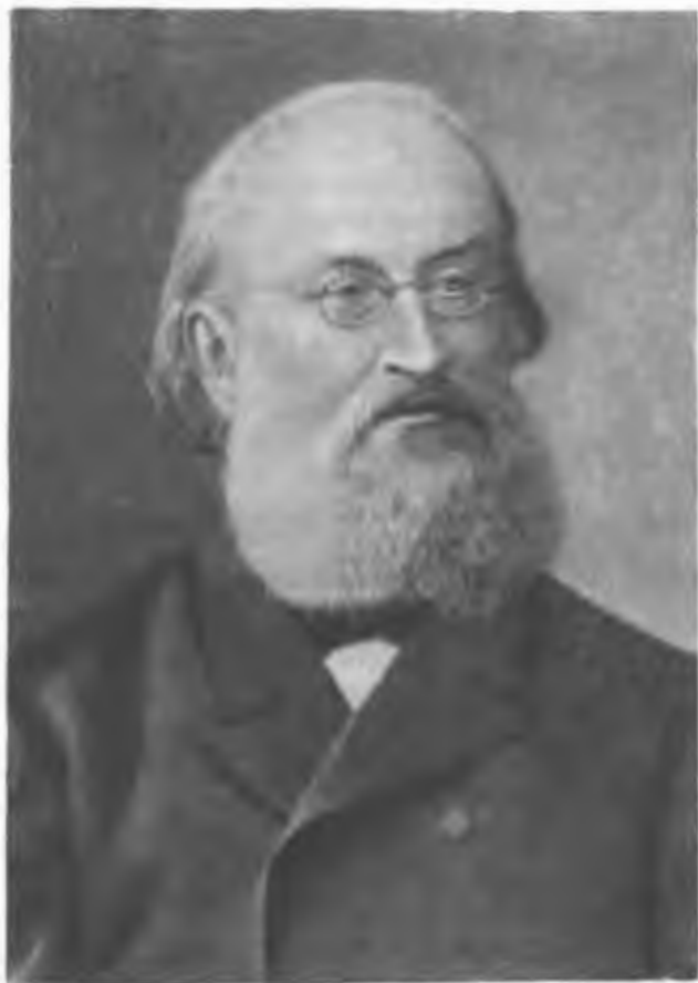
Густав Роберт Кирхгоф (1824—1887)