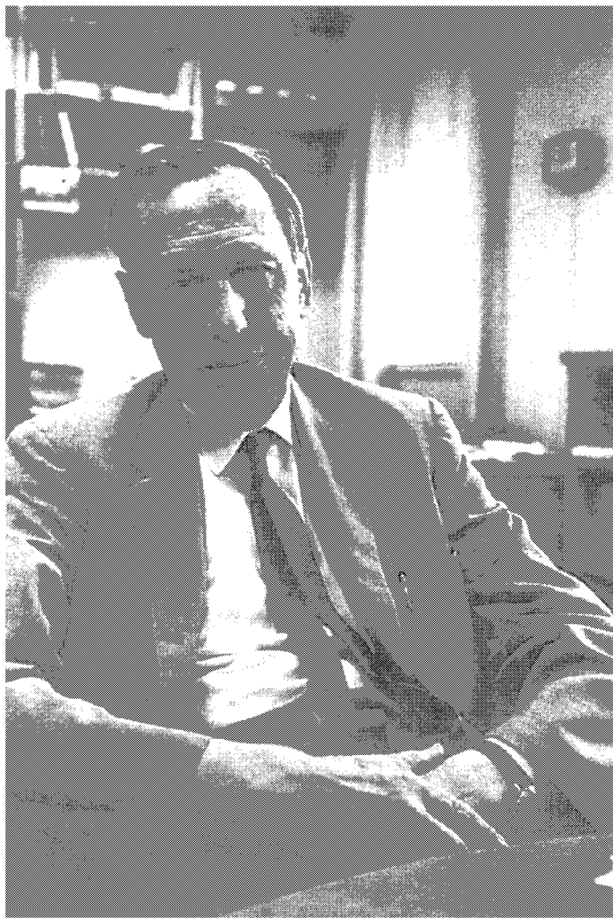
Джордж Уленбек в своем кабинете в Рокфеллеровском университете, примерно 1970 год.